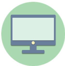
Equipo de Cómputo

Para ingresar al CRM Web se debe contar con lo siguiente: