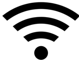
Conexión Estable a Internet (Conexión LAN)